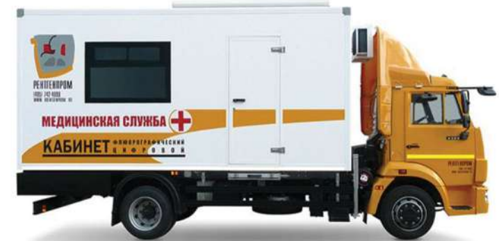
Кабинет флюорографический подвижной с цифровым флюорографом КФП-Ц-РП